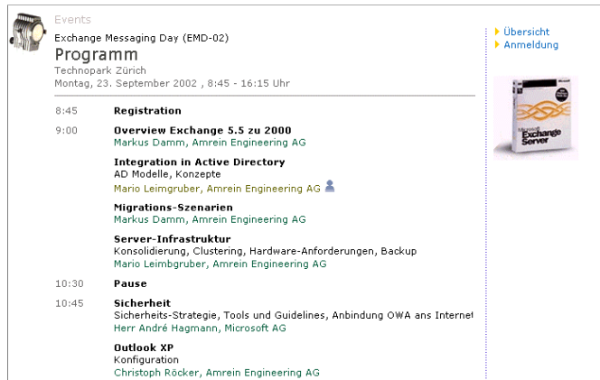
Detailprogramm der Veranstaltung

Der klare Aufbau der Seiten, die Internettechnologie mit dem intuitiven Finden von Informationen und die einfache Benutzerführung lassen die KURSVERWALTUNG zu einem einfachen und von allen schnell genutzten Werkzeug werden. Eine kurze Einführung der Mitarbeitenden in das Tool genügt. Für die Verantwortlichen stehen umfangreiche Berechtigungs- und Rollenkonzepte für die Verwaltung der Daten sowie für die Ausschreibungen zur Verfügung.